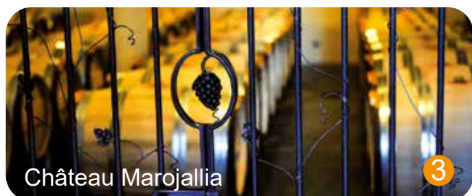
Château Marojallia 3